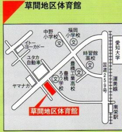
☎48-4545 ●交通機関 豊鉄バス大母線「ろう学校前」 豊鉄 渥美線「南栄」