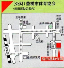
☎63-3031 ●交通機関 市電「運動公園前」