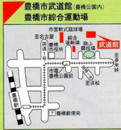
☎56-6023 武道館 ☎56-6051 総合運動場 ●交通機関 市電「豊橋公園前」下車 北へ徒歩5分