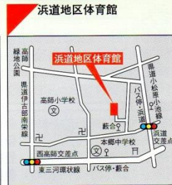
☎47-4986 ●交通機関 豊鉄バス 浜名線・細谷線「浜道」 豊鉄バス 浜名線「藪合」