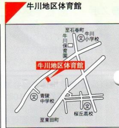
☎53-0950 ●交通機関 豊鉄バス 富岡線「青陵中学校前」