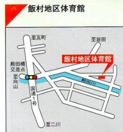
☎62-7010 ●交通機関 豊鉄バス 飯村岩崎線「飯田橋」