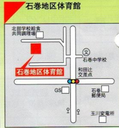
☎88-4970 ●交通機関 豊鉄バス 富岡線・全沢線「和田辻」