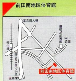
☎53-0103 ●交通機関 豊鉄 渥美線「柳生橋」